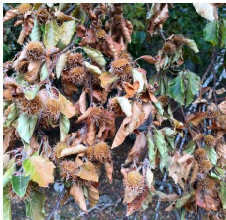
Feuilles desséchées lors d'un été caniculaire - Hêtre