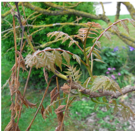
Gel printannier de jeunes pousses Savonnier - 18 mai 2017