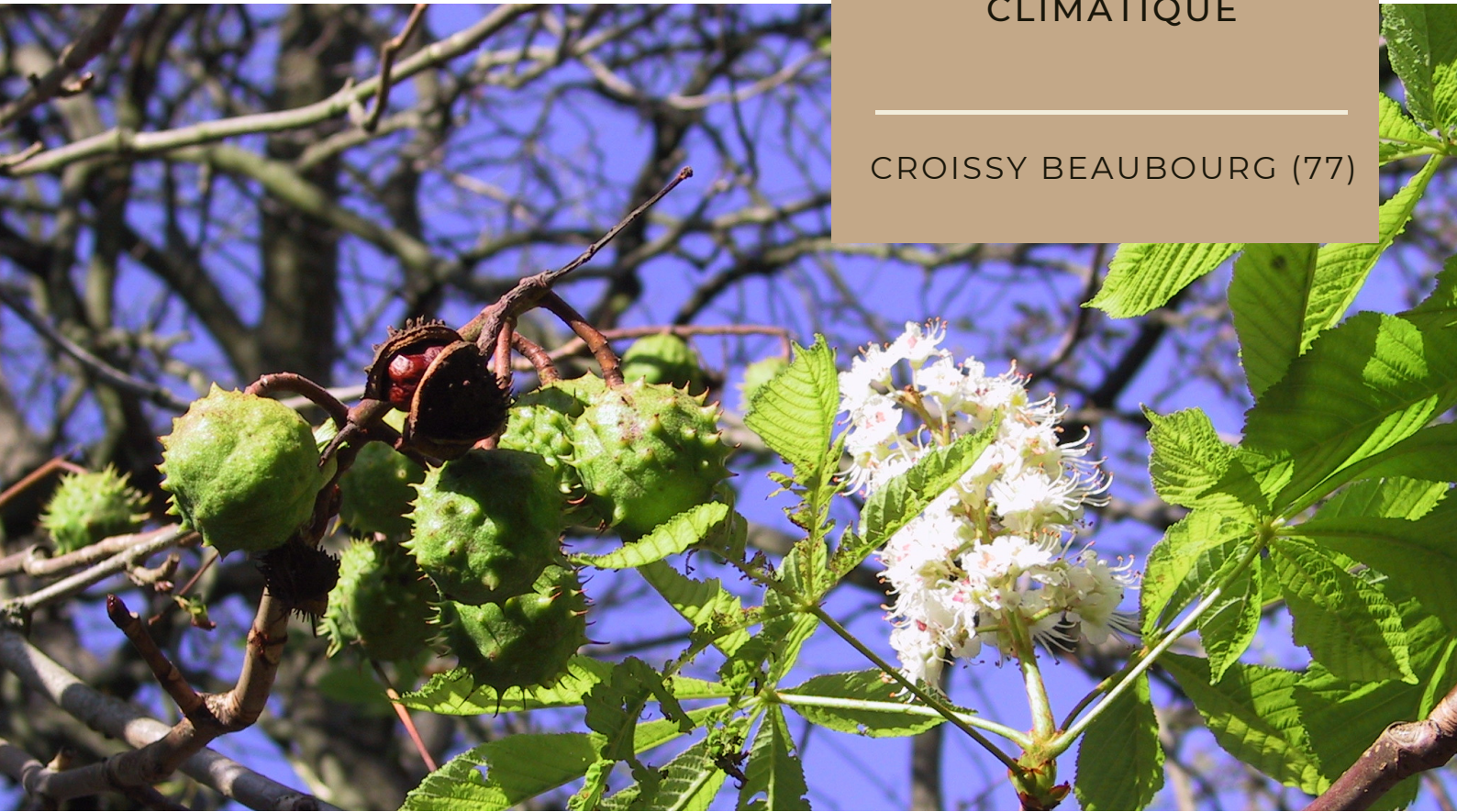
Fructification associée à une seconde floraison en automne - Marronnier - 16 septembre 2003