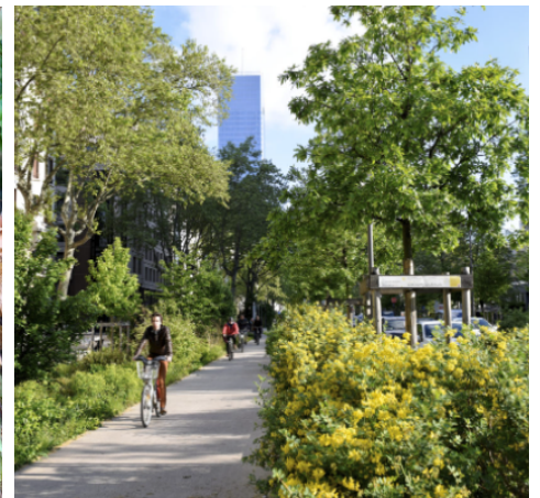
Avenue Garibaldi à Lyon

Retrouvez les informations concernant les arborencontres précédentes et préparez votre déplacement (covoiturage) en consultant le site www.arbrecaue77.fr . Inscrivez-vous à la newsletter pour être tenu informé des futures manifestations et publications.