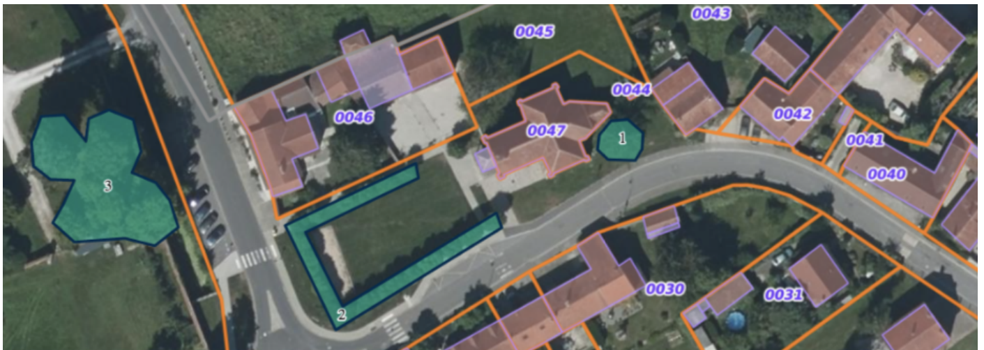
Protection des arbres dans le PLU

Le 12 juillet 2023 le parlement européen a adopté la loi sur la restauration de la nature. Le règlement stipule à l'article 6 concernant la Restauration des écosystèmes urbains que :