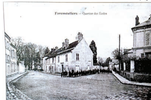
Rue des Moutiers, 1905