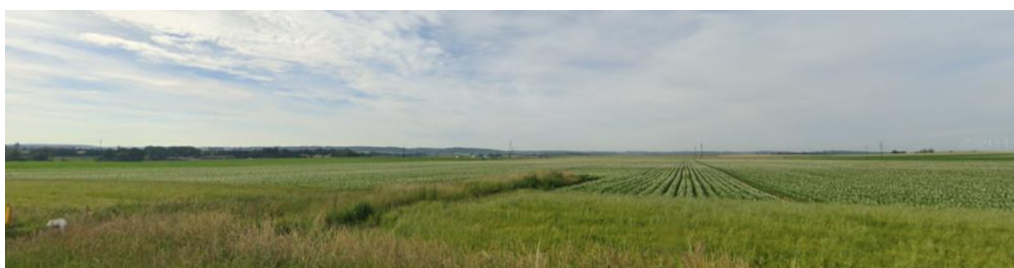
Vue lointaine depuis l'Ouest