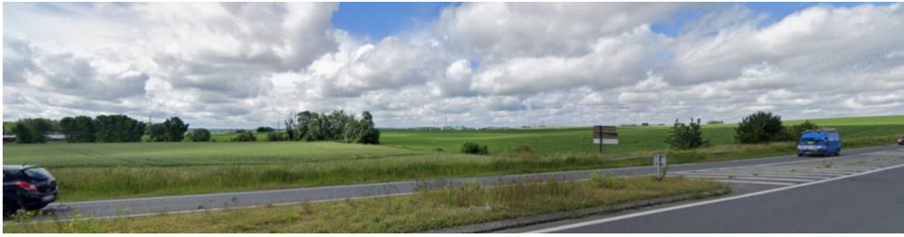
Vue lointaine depuis l'Est