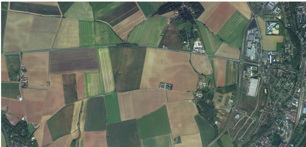
Plan de situation de l'installation

En effet, le méthaniseur est implanté sur un terrain agricole, sans lien apparent avec un immeuble ou un équipement voisin. Mais il est en fait dépendant de la ferme à coté de laquelle il est installé et le personnel qui le fait fonctionner est implanté au hameau voisin. Tant les biodéchets que le digestat produit par le méthaniseur sont issus des installations agricoles avoisinantes.