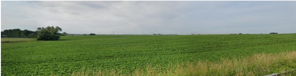
Vue depuis l'est

En revanche, elle l'est moins depuis les liaisons secondaires qui relient les hameaux voisins.