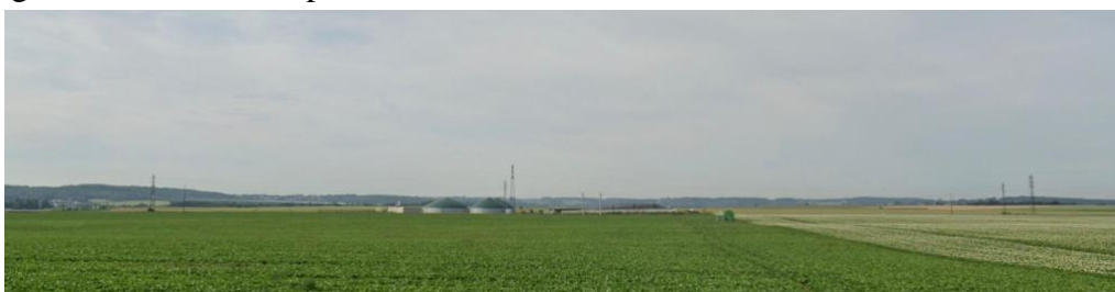
Vue depuis le Nord-Ouest

L'installation est parfaitement visible depuis la route principale qui passe au Nord de la parcelle agricole où elle est implantée.